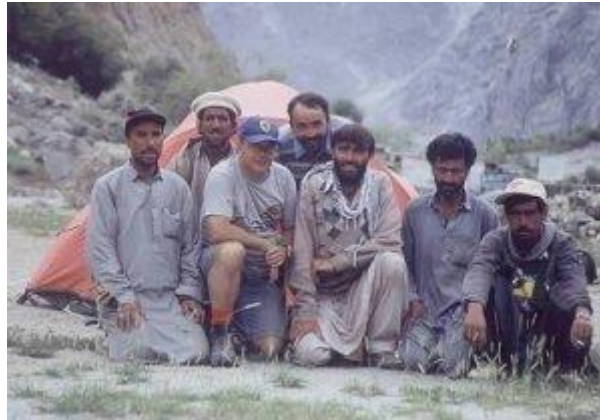
Zurück in Askole Camp