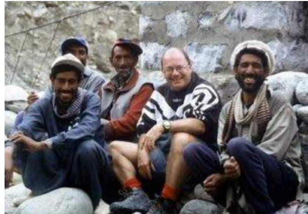
Mittagspause bei der Jhola-Brücke