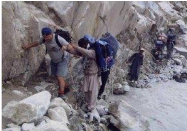
Die heikle Passage